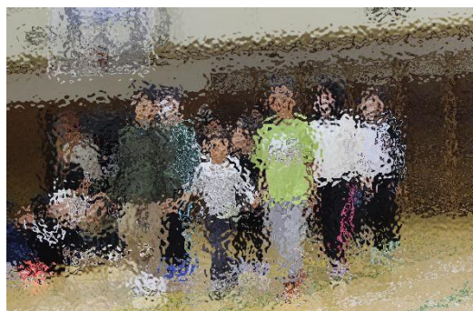
6年生と手をつなぎ、1年生が入場！

全校遊びで全校児童で交流を深め、その後2～6年生が素敵な歌声で校歌を1年生に披露、その後1年生がお礼の言葉とダンスで、感謝の気持ちを伝えました。高学年のリーダーシップ、在校生の優しさ、そして1年生の成長の姿のうかがえる素晴らしい会となりました。