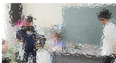
6年生がリーダーとなり、活動を進行！