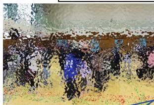
全校遊びで楽しいひとときを過ごしました。