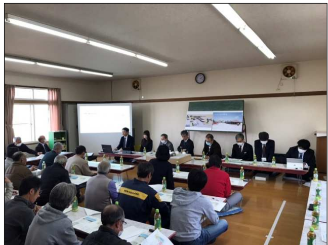
【意見交換会の様子】

また、町民参加の方法によって寄せられた意見等を総合的に検討し、意見等の検討を終えたときは、速やかにかつ多様な方法を用いて町民に公表できているか。